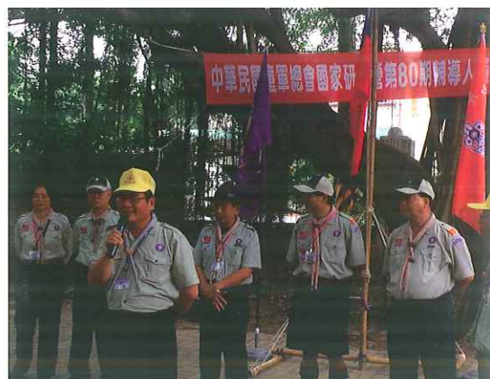
王處長認為童軍可培養青少年生活能力