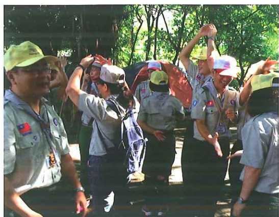
大家熱誠的參與遊戲

國立彰化師範大學輔導諮商學系兼任助理教授 中華民國童軍總會國家研習營助理訓練員 / 梁峻哲 撰