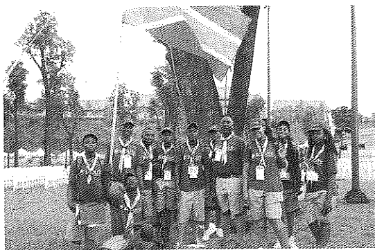
南非童軍跨海來台、感恩佛光山之旅 普賢佛光童軍團長 / 余玻莉 撰

2019年七月份將舉行三年一次北美大露營，有望法師積極邀約台灣佛光童軍伙伴可以組團參與，並隨後參與第24屆世界童軍大露營，讓世界一起看見佛光童軍。