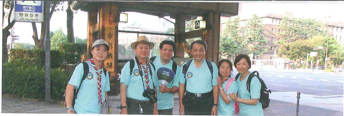
名古屋城小隊旅行暨闖關活動(服務員擔任關主)活動結束後服務員在捷運站入口處合照

環境，自己也不自覺就跟著一起這樣的微笑及鞠躬了。這有如成人服務員們在帶團是一樣的道理，你如何對待你的夥伴，夥伴也會有相同的回應。